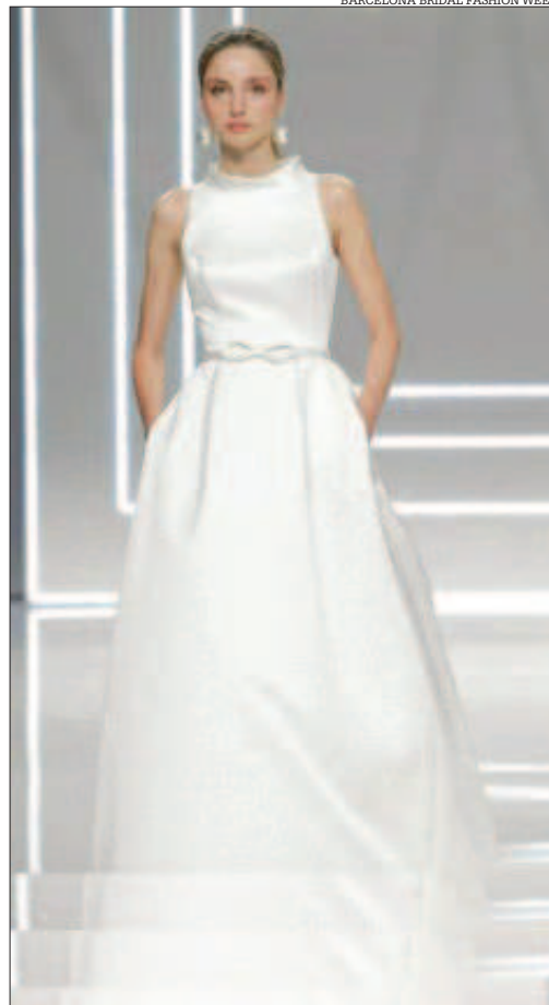
Model de Rosa Clará.