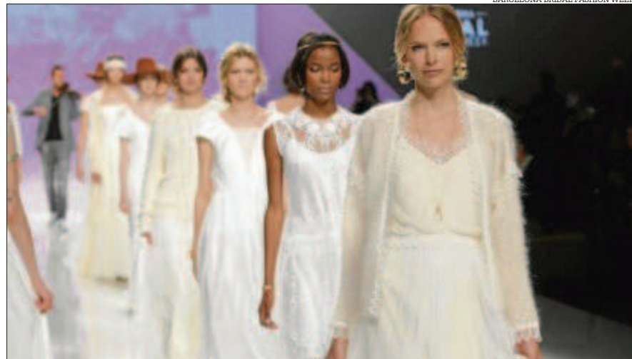
Final de la desfilada de Marylise.